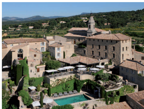
Relais & Chateaux Hotel Crillon le Brave