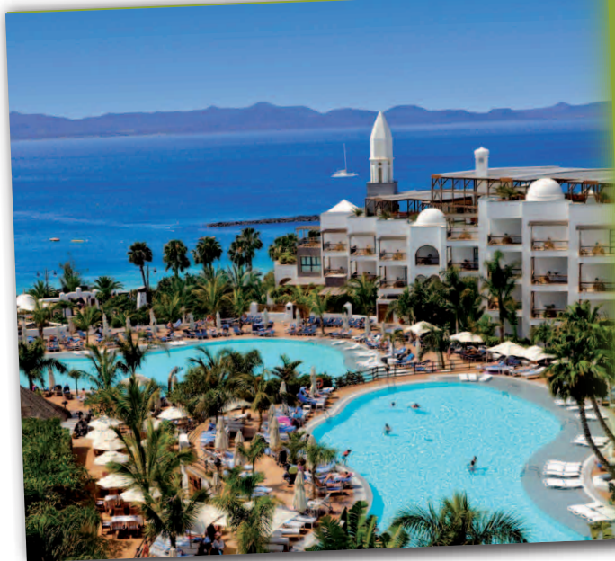
Princesa Yaiza Suite Hotel Resort